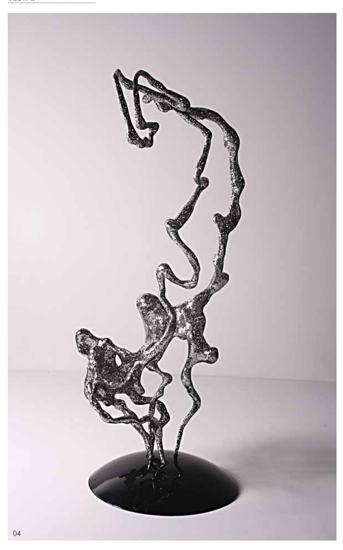
04 淋漓 郑 昪